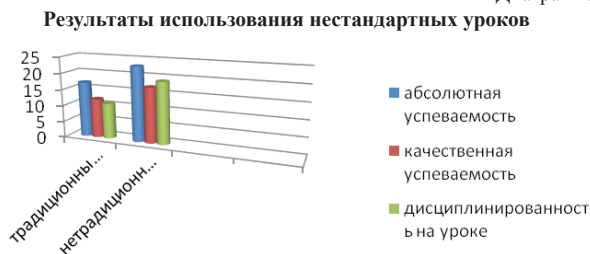
Диаграмма № 1

В результате проведения урока в нетрадиционной форме, как показывает диаграмма, качественная и абсолютная успеваемость выросла приблизительно на 20%. Абсолютная успеваемость с 73% увеличилась до 100%, качественная успеваемость – с 52% до 73%. Дисциплина на уроках также изменилась в лучшую сторону. На 34% более дисциплинированно пятиклассники ведут себя на уроках, где организуется нетрадиционный подход к преподаванию.