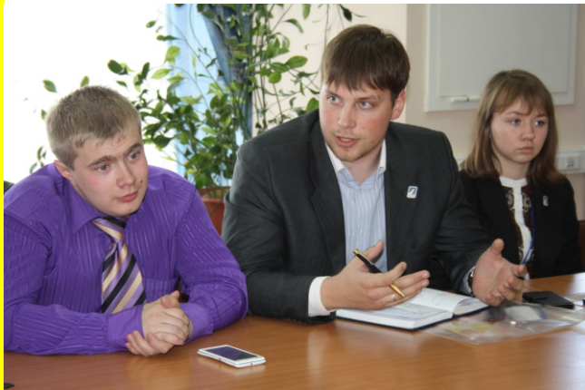
Молодежный форум «Вместе - мы сила»

Президенте Российской Федерации по международным отношениям В.И. Цо объявил благодарность за отличную подготовку и проведение Международного Форума молодежи Сибири и Дальнего Востока "Вместе-мы сила", прошедшего на базе Томского государственного педагогического университета, студентам и сотрудникам-организаторам ТГПУ.