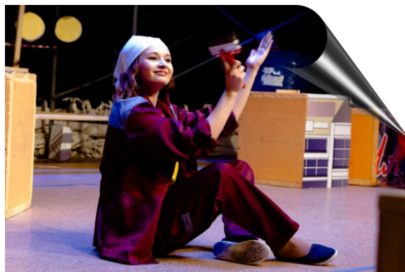
Фестиваль «Студенческая весна 2015»

Молодежный фестиваль "Всероссийская студенческая весна" направлен на поддержку и развитие студенческого творчества. В этом году фестиваль был самым масштабным за последние годы. Более 2000