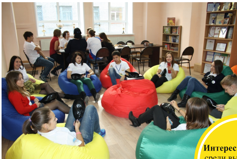
Открытие Молодежного центра ТГПУ