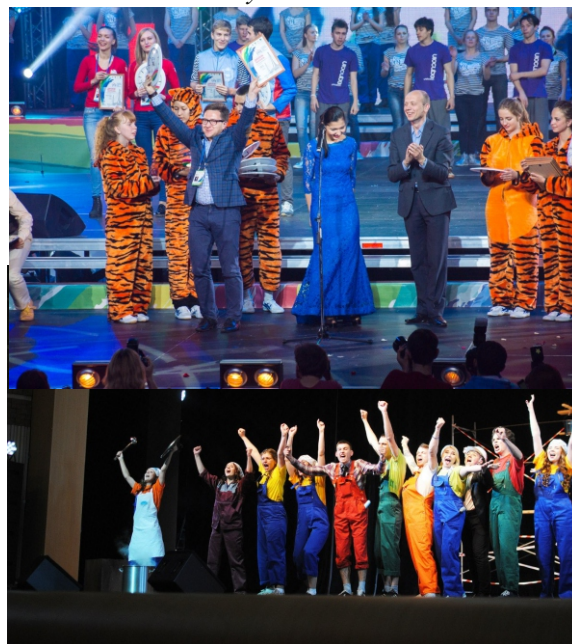
Фестиваль «Студенческая весна 2015»