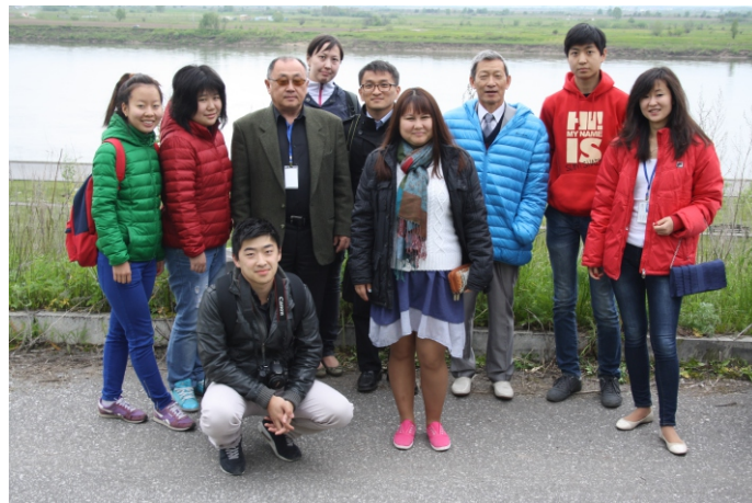
Молодежный форум «Вместе - мы сила»

Важный факт: по данным Российского индекса научного цитирования ТГПУ занимает первое место среди вузов Томска и пятое среди вузов России