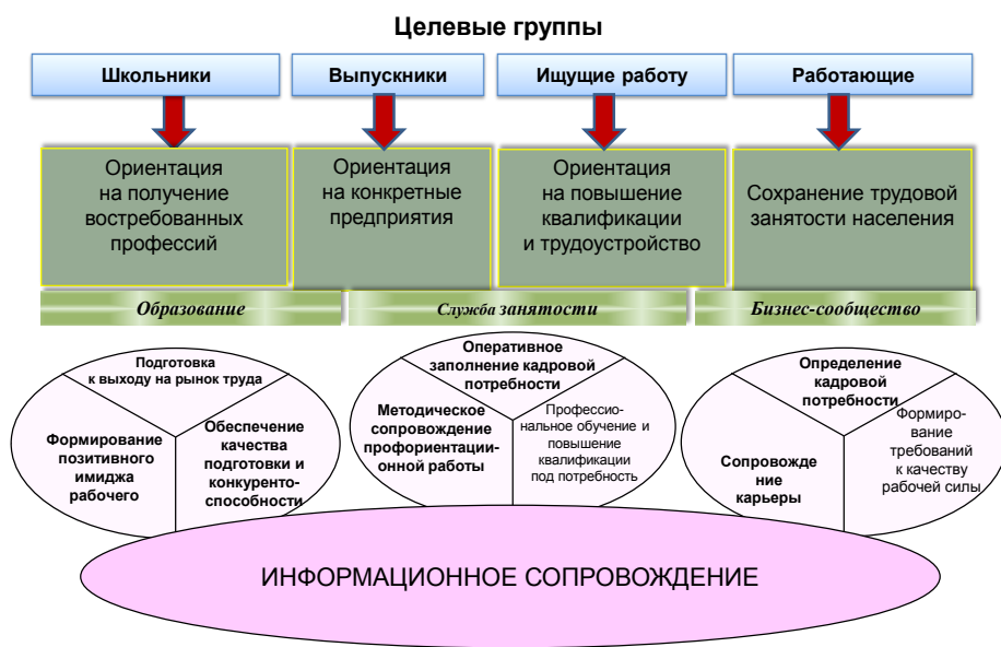
Рис. 2. Структура сетевого взаимодействия вузов и государственной службы занятости населения

В процессе исследования была разработана структура сетевого взаимодействия вузов и государственной службы занятости населения по информационному сопровождению различных категорий молодежи в сфере трудоустройства (рис. 2).