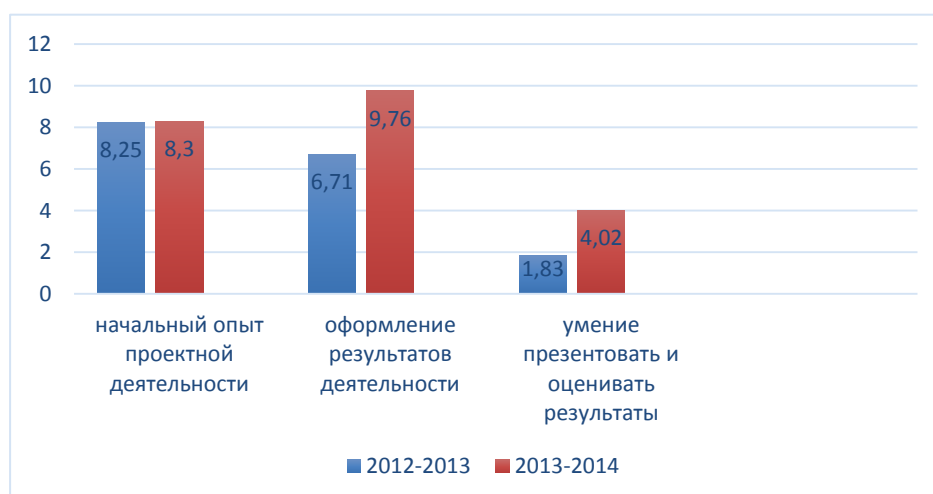
Диаграмма 1. Выборочное среднее за период с 2012 по 2014 годы

было установлено, что по первому показателю значение выросло на 0,6%, по второму показателю увеличение произошло на 45,5%, а третий показатель увеличился на 19,97%. Графически положительную динамику изменений можно увидеть на диаграмме 1.