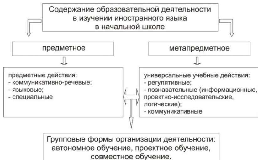
Рисунок 1. Содержание и формы организации образовательной деятельности при изучении иностранного языка в начальной школе

Таким образом, реализация предметного и метапредметного содержания образовательной деятельности требует соответствующих форм её организации (рисунок 1). При этом под формой организации образовательной деятельности мы понимаем внешнее выражение совместной деятельности педагога и учащихся, которое характеризуется их определенными позициями: педагог находится в двойственной позиции организатора – участника совместной образовательной деятельности (Г.Н. Прокументова), а ребёнок – в позиции её значимого и влиятельного участника (С.И. Поздеева).