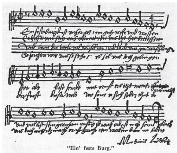
Рис. 1. Гимн «Ein feste Burg» в нотной записи

Среди собственных сочинений Лютера – христианские гимны, например, «Ein feste Burg» («Господь – наш истинный оплот»). Вот копия этого гимна в нотной записи того времени [2] (рис. 1):