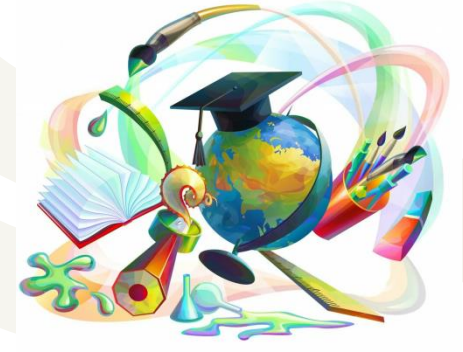
ВАРИАТИВНАЯ ПРОФИЛЬНАЯ ПОДГОТОВКА

НАВЫКИ ВЫПОЛНЕНИЯ ТРУДОВЫХ ОБЩЕПЕДАГОГИЧЕСКИХ ФУНКЦИЙ (ОБУЧЕНИЕ, ВОСПИТАНИЕ, РАЗВИТИЕ ОБУЧАЮЩИХСЯ); ОРГАНИЗАЦИИ ДОПОЛНИТЕЛЬНОГО ОБРАЗОВАНИЯ И ДОСУГОВОЙ ДЕЯТЕЛЬНОСТИ ДЕТЕЙ И ВЗРОСЛЫХ ПО ДЕКОРАТИВНО-ПРИКЛАДНОМУ ИСКУССТВУ И ДИЗАЙНУ, В ТОМ ЧИСЛЕ С ИСПОЛЬЗОВАНИЕМ ИНФОРМАЦИОННО-КОММУНИКАЦИОННЫХ ТЕХНОЛОГИЙ